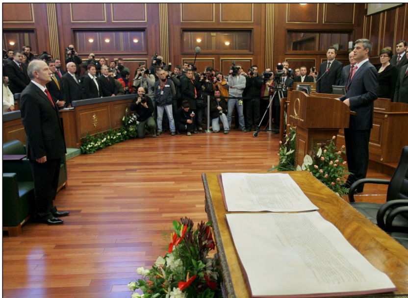
Declarația independenței Kosovo în Parlamentul de la Priștina

Revistă pentru românii de pretutindeni editată de Centrul de Studii pentru Resurse Românești Contact: office@centruldestudii.ro